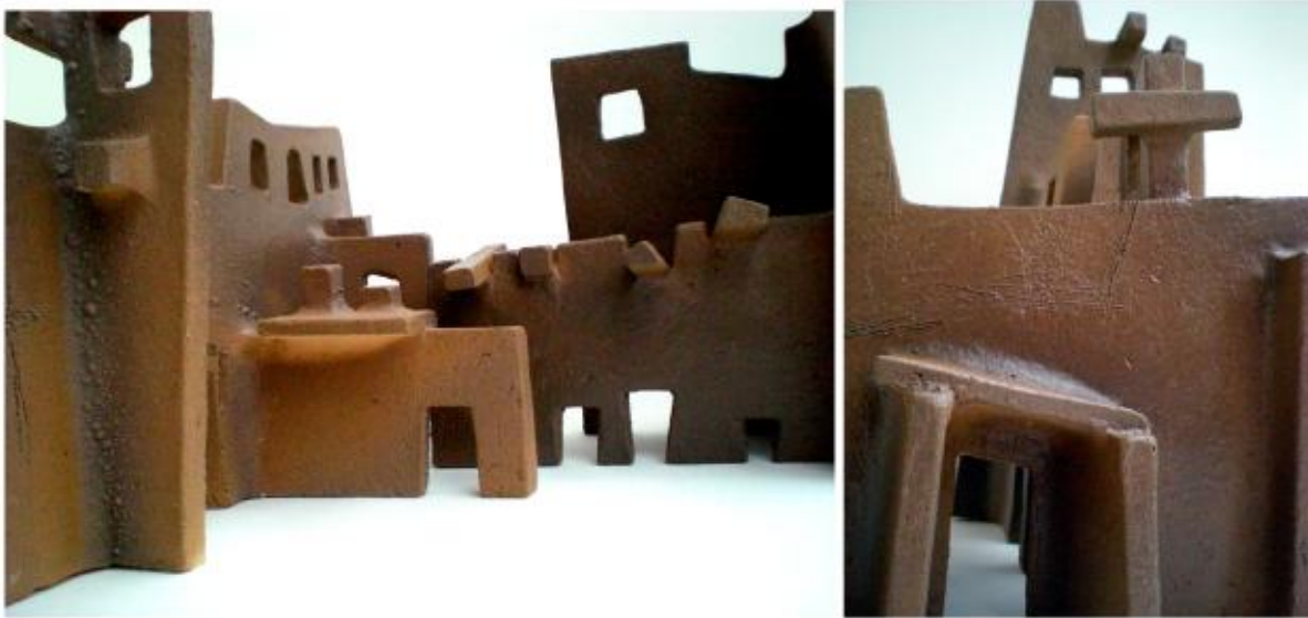
Passages of the Architectural Collages Serie Earthenware clay, handbuilt, 2010.