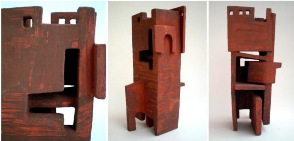
“Avanos 2” Handbuilt earthenware clay, 2007.

scale, a thing perceived only in the course of long spans of time...At every instant there is more than the eye can see, more than the ear can hear, a setting or a view waiting to be explored ” (p.1). The general pattern of Cappadocia area forming a mosaic along the hillside which is carved into the natural rocks of the region that can be easily worked up, the front sides of which are constructed by block stones, and which is seen as if they are meshed when looking from the outside... This pattern is a collage in which the terrace of a house is sometimes formed by the roof of another house, resembling a puzzle from a distance, and a maze with its complex and linked connections when it is seen from the inner side. For me, this image has been a pool of visual materials by which I can form my own collage by choosing the window, door, part of wall and a section that I want.