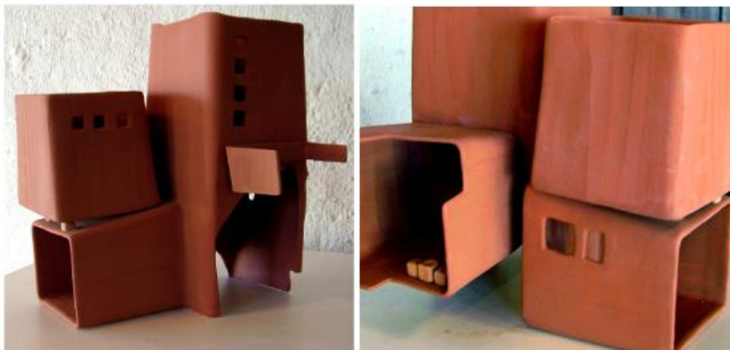
"Avanos" Slipcasted earthenware clay, 2007.

The effects reflected mostly to my ceramic works in the following years belong to the architectural structure of Cappadocia area thanks to my regular visits to Avanos which is a ceramist town. This area which has experienced a geological structure and processes which cannot be found anywhere has a unique outlook. And, it is so exciting for the people who visit this area for the first time to see this structure. This architectural image together with geographical view that may become ordinary after a while for the people living here or visiting here frequently hides many compositions for me which are always open for discovery.