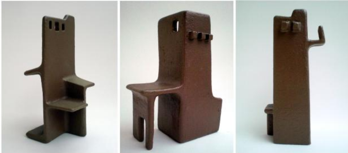
Example pieces of the Architectural Collages Serie Earthenware clay, handbuilt, 2010.