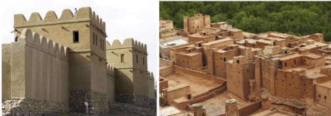
Architectures made of clay

Also, I always think that a childish pleasure to play games is hidden in the relationship between an adult and clay. Moreover, acquaintance with soil is established in the childhood period in which people are satisfied with a sense of touch as much as possible as they began to be acquainted with the nature. We can see that every child, and even every adult, digs a pit slowly by hand while sitting on the beach. It is fun for a kid to scratch humid soil which is easy to dig. And, to begin construction by molding with cans after storing soil or humid sand dune on one side is a very common game for most children. As stated by Rasmussen, this game continues to exist in a branch of art that meets needs and creates emotional and esthetical living spaces, namely architecture as called by adult people.