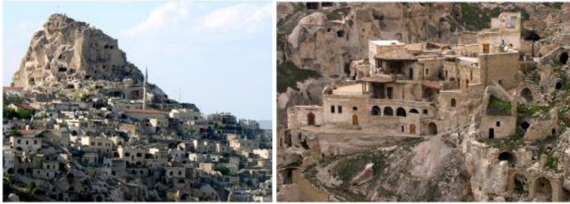
Architecture of Cappadocia (Nevşehir, Turkey)

The effects reflected mostly to my ceramic works in the following years belong to the architectural structure of Cappadocia area thanks to my regular visits to Avanos which is a ceramist town. This area which has experienced a geological structure and processes which cannot be found anywhere has a unique outlook. And, it is so exciting for the people who visit this area for the first time to see this structure. This architectural image together with geographical view that may become ordinary after a while for the people living here or visiting here frequently hides many compositions for me which are always open for discovery.